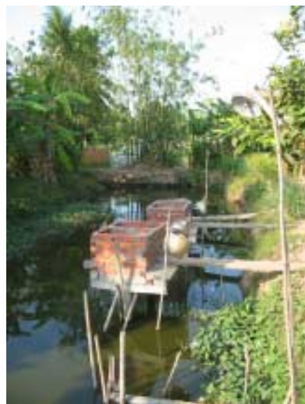
«Sky Toilet» для общественного использования

Многие вьетнамцы в районе дельты Меконг не используют грунтовую воду в качестве питьевой воды, в то время как поверхностная вода считается не вызывающим сомнений основным источником питьевой воды. Поверхностная вода вытекает из каналов, рек и прудов и обычно плохого качества, так как эти водные родники являются источниками разнообразных микробиологических и химических заражений. Каналы служат водным путём для судов, сбросов мусора, туалетов, ванн, мытья посуды, полоскания белья и животноводства. Таким образом, нефтяные остатки, отбросы, кал, мыло и т.д. находятся в воде, которая служит для пищевого употребления. Чтобы получить как можно менее загрязнённую воду, жители ходят за водой только во время незначительной эксплуатации канала, а так же во время наводнений (подъем морского прилива в дельте отчетливо фиксируется).