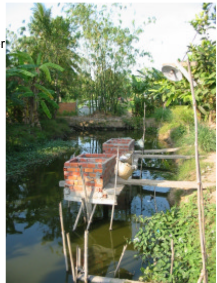
„Sky Toilet“ zur öffentlichen Nutzung

Viele Vietnamesen im Mekong Delta lehnen Grundwasser als Trinkwasser ab, während Oberflächenwasser als unbedenkliches Trinkwasser angesehen wird. Das Oberflächenwasser stammt aus Kanälen, Flüssen und Teichen und ist immer mikrobiell und chemisch stark belastet, da diese Wasserquellen vielfältigen Kontaminationsquellen ausgesetzt sind. Kanäle dienen als Wasserweg für Schiffe, Müllkippen, Toiletten, Spülküchen, Waschsalon, Tierzuchtort und Badewannen. Somit finden sich Ölreste, Abfall, Fäkalien, Seife u.ä. im Wasser, welches dem menschlichen Verzehr dient. Um ein möglichst gering belastetes Wasser zu erhalten, entnehmen die Anwohner Wasser nur in Zeiten mit geringerem Betrieb auf dem Kanal und zu Hochwasserzeiten (Tidenhub im Delta ist deutlich feststellbar).