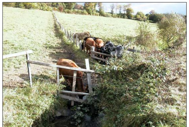
Abbildung 1: Tiere am Bach

Dieses Projekt legt sein Augenmerk auf die Problemstellung, dass hygienisch-mikrobiologische Kriterien bei den einschlägigen Bewirtschaftungsstrategien eine untergeordnete Rolle spielen, obgleich der Nutzungsdruck auf Fließgewässer zunimmt. Wasserbezogene Freizeitaktivitäten sowie die Nutzung der Fließgewässer zur Beregnung von Freilandkulturen oder als Tränkwasser für Weidevieh sind nur einige Beispiele. Gleichzeitig gibt es keine rechtlichen Grenzwerte für die Einleitung von Mikroorganismen aus dem Bereich der Siedlungswasserwirtschaft in Fließgewässer.