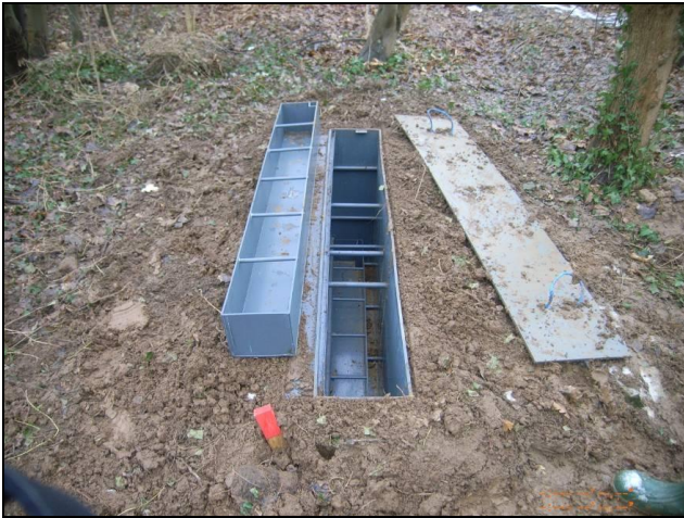
Abbildung 2: Rackstation am Ohrbach

Übertragbarkeit der Ergebnisse auf andere Flussgebiete gewährleistet werden (Swistbox).